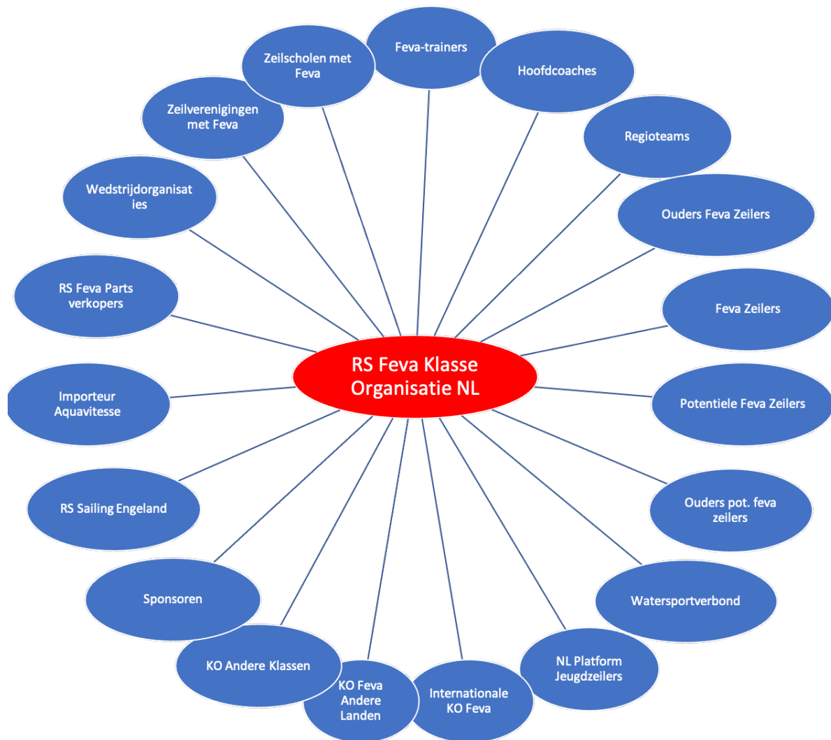
Relatie-diagram RS Feva klasse-organisatie

De rol van de leden en ouders van leden is in het vorige hoofdstuk reeds benoemd. Onder de diagram is een aantal andere betrokkenen uitgelicht en toegelicht.